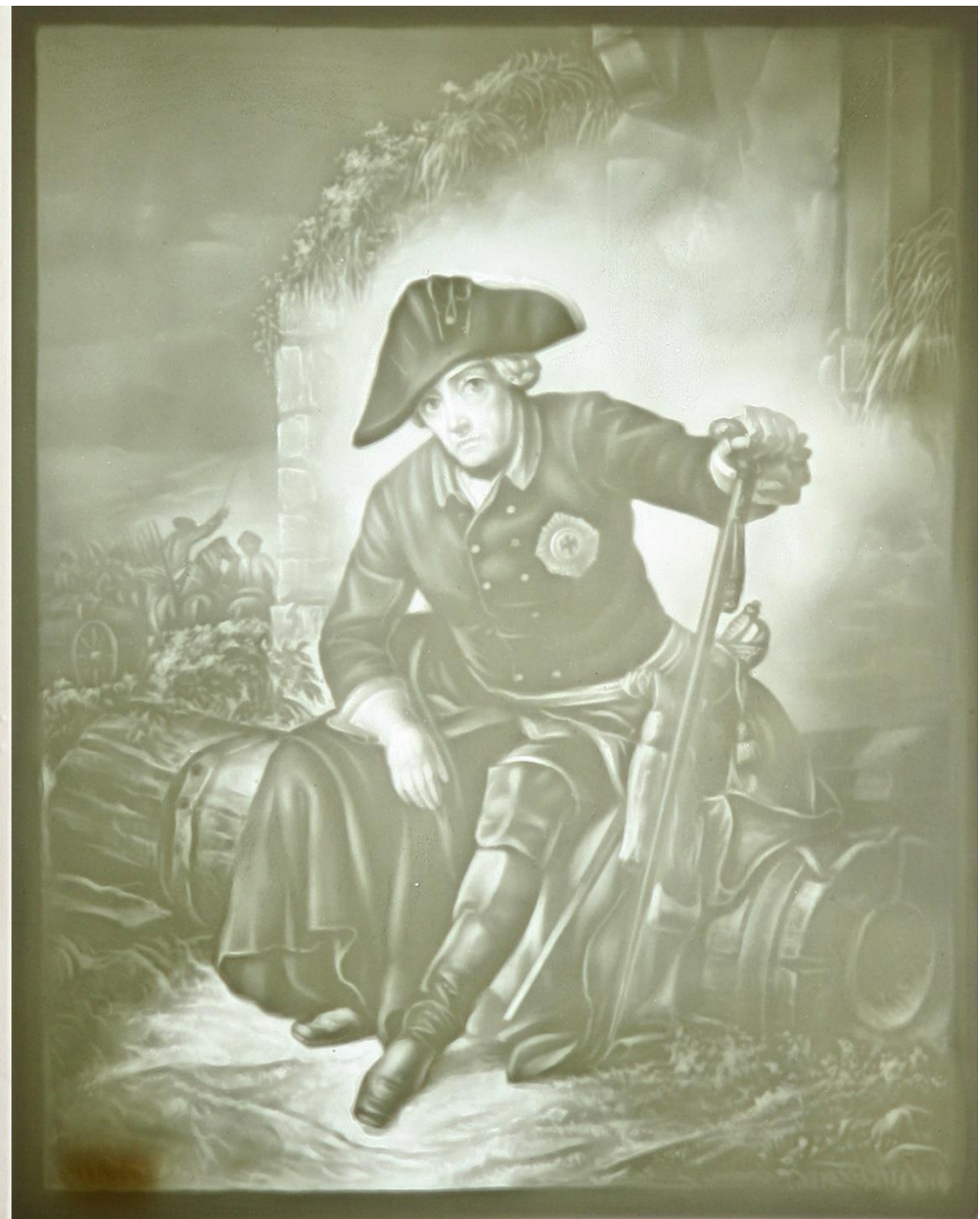
Литофания Фридриха Великого по мотивам известной картины Юлиуса Шредера (1849 год), справа — освещенный спереди, слева — освещенный сзади