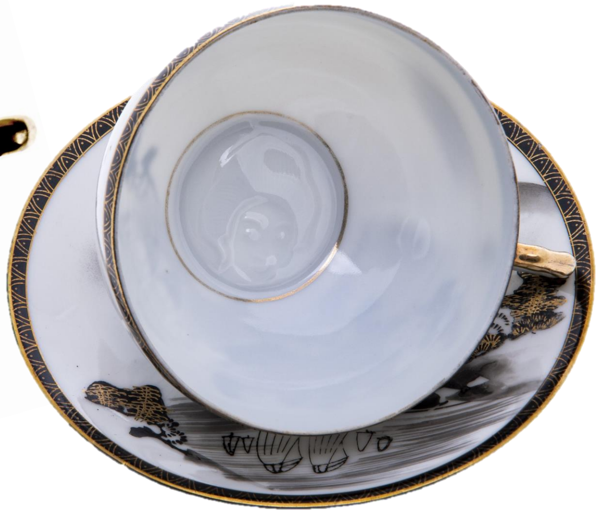
Сервиз чайный "Бессмертие" на 4 персоны, 16 предметов. Фарфор, рельефная роспись, литофания. Satsuma, Япония, середина 20 века