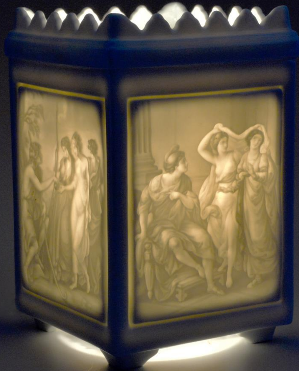
Лампа с литофанией Vista Alegre, Португалия, середина 19 века